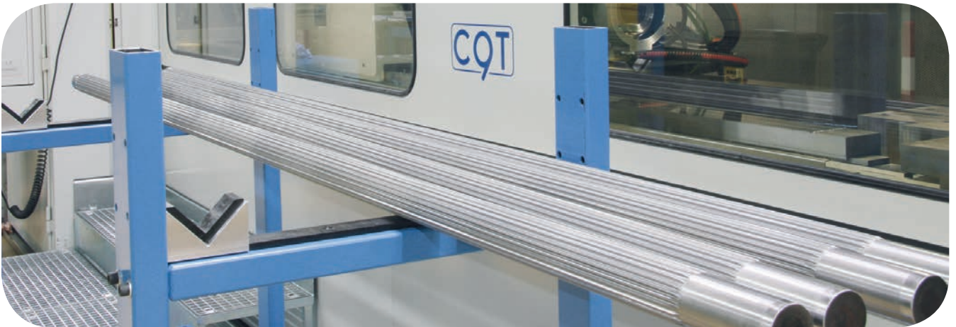
Verzahnte Wellen für Doppelschnecken-Extruder